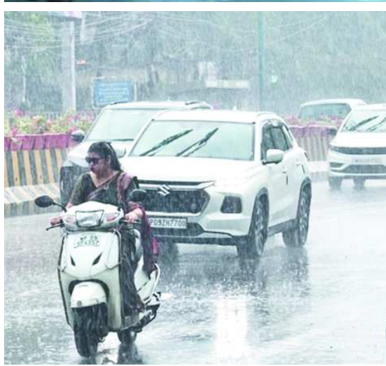
इंदौर। तीन दिन की लगातार झमाझम बारिश के बाद आज अलसुबह से ही शहर में रिमझिम बारिश का दौर जारी है।