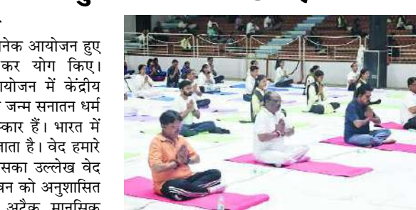
योग अब ज्यादा आवश्यक है।

इंदौर • इंदौर में योग दिवस पर अनेक आयोजन हुए और लोगों ने अनेक आसन कर योग किए। बास्केटबॉल स्टेडियम में हुए आयोजन में केंद्रीय मंत्री दुर्गादास ने कहा कि भारत का जन्म सनातन धर्म में हुआ है। हमारे देश में 16 संस्कार हैं। भारत में जन्मे व्यक्ति को पुरुषोत्तम कहा जाता है। वेद हमारे पूर्वजों की जीवन शैली रहे हैं। इसका उल्लेख वेद और उपनिषदों में भी है। योग जीवन को अनुशासित और संतुलित बनाता है। अब हार्ट अटैक, मानसिक अशांति और तनाव के मामले बढ़ने लगे हैं। ऐसे में