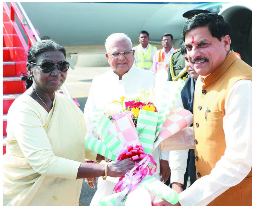
इंदौर। राष्ट्रपति श्रीमती द्रौपदी मुर्मू का आज इंदौर एयरपोर्ट पर मुख्यमंत्री डॉ. मोहन यादव ने किया स्वागत।

10 से ज्यादा पुलियाओं का काम लगभग पूरा होने पर जनता के लिए खोलने की तैयारी हो गई है। पुलियाओं के बचे काम पूरे करने के निर्देश जिम्मेदार अफसरों को दे दिए गए हैं।