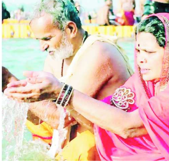
पितरों को तर्पण करने से पितृ दोष नदी में स्नान करने नहीं जा पा रहे हैं तो घर पर पानी में गंगाजल

15 जून को ही सोमवती अमावस्या मनाई जाएगी। सोमवती अमावस्या के दिन पवित्र नदियों में स्नान, भगवान शिव और विष्णु की पूजा, पीपल वृक्ष की परिक्रमा, तर्पण तथा दान-पुण्य करने से विशेष फल की प्राप्ति होती है। महिलाएं सोमवती अमावस्या के दिन पति की लंबी आयु के लिए जहां व्रत रखती हैं, वहीं पितृ दोष निवारण के लिए भी दिन अत्यंत शुभ माना गया है। इस अमावस्या पर किए गए दान-पुण्य और तीर्थ स्नान से अक्षय पुण्य मिलता है, मन शांत होता है और नकारात्मक विचार दूर होते हैं। सोमवती अमावस्या पर पितृ तर्पण का महत्व: गरुड़ पुराण में बताया गया है कि सोमवती अमावस्या पर पितरों का तर्पण करना बहुत शुभ होता है, इस दिन