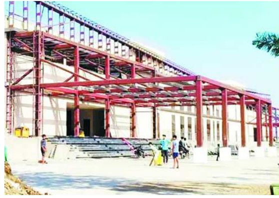
तोड़ जाएगा पुराना भवन- रेलवे अधिकारियों ने बताया कि पुराने स्टेशन भवन से नए भवन में शिफ्टिंग पूरी होते ही पुरानी स्टेशन बिल्डिंग को तोड़ने का काम शुरू किया जाएगा। भवन हटने के बाद उसकी जगह अतिरिक्त रेलवे ट्रैक और नया प्लेटफॉर्म बनाया जाएगा, जिससे स्टेशन की क्षमता और बढ़ेगी। इसके साथ ही यात्री