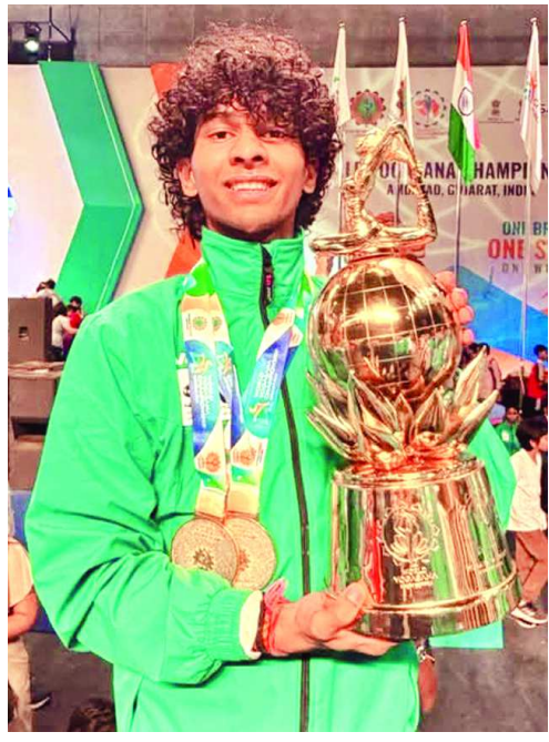
दैनिक इंदौर संकेत

इंदौर • मद्रास टैलेंट डेवलपमेंट स्कूल, सुरखलिया, इंदौर के कक्षा 12 वीं (बायो) के होनहार छात्र ने न केवल मध्य प्रदेश का नाम बढ़ाया है, बल्कि 40 देशों के सामने योगा करके गोल्ड मेडल प्राप्त कर भारत का नाम रोशन किया है, विद्यालय परिवार आपके उज्ज्वल भविष्य की कामना करता है।