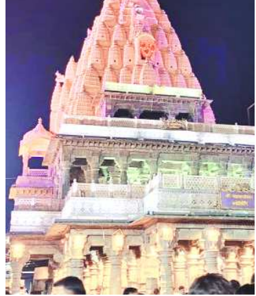
श्रद्धालुओं की आवाजाही के बीच यह सिस्टम सुरक्षा और व्यवस्थाओं को लगातार मॉनिटर करता है। इस हाईटेक सुरक्षा व्यवस्था को

दैनिक इंदौर संकेत उज्जैन • श्री महाकालेश्वर मंदिर अब सिर्फ आस्था का केंद्र नहीं, बल्कि देश के सबसे स्मार्ट और हाईटेक धार्मिक स्थलों में भी शामिल हो गया है। केंद्र सरकार ने महाकाल मंदिर को राष्ट्रीय ई-गवर्नेंस पुरस्कार 2026 के लिए चुना है। यह सम्मान मंदिर परिसर और महाकाल रुद्रसागर इंटीग्रेटेड डेवलपमेंट एरिया में स्थापित अत्याधुनिक एआई आधारित वीडियो सर्विलांस सिस्टम के लिए दिया जा रहा है। महाकाल मंदिर में श्रद्धालुओं की सुरक्षा और भीड़ प्रबंधन के लिए 500 से अधिक एआई-सक्षम कैमरे लगाए गए हैं, जो 24 घंटे निगरानी करते हैं। यह सिस्टम संदिग्ध गतिविधियों की पहचान, फेसियल रिकॉग्निशन, वाहनों की नंबर प्लेट की ऑटोमैटिक पहचान और रियल टाइम वीडियो एनालिटिक्स जैसी अत्याधुनिक तकनीकों से लैस है। लाखों