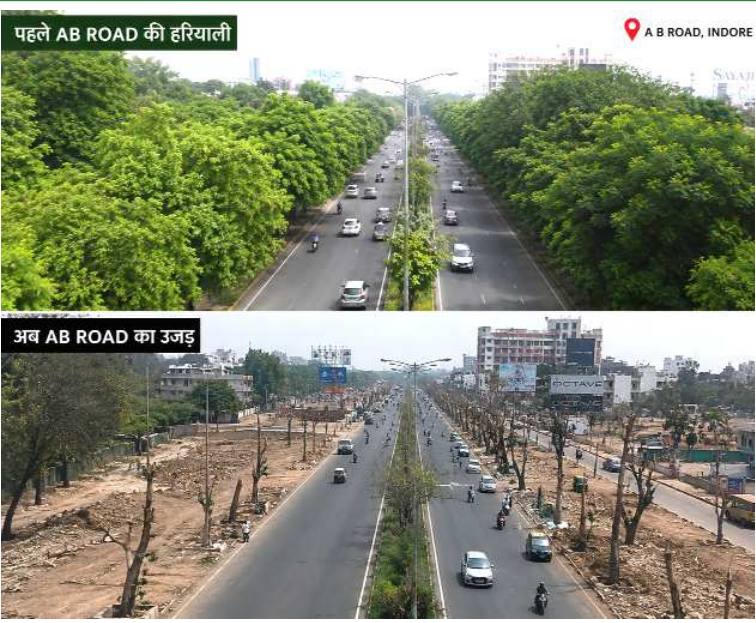
पहले AB ROAD की हरियाली

कांग्रेस के 'धोखे' से भड़की डीएमके-डीएमके मुख्यालय की ओर से दिल्ली की बैठक में शामिल न होने का बयान जारी किया गया है। इसके कुछ घंटों बाद ही एलंगोवन ने समाचार एजेंसी एएनआई से गठबंधन छोड़ने की पुष्टि की। डीएमके के इस बड़े कदम के पीछे की मुख्य वजह कांग्रेस का रख है।