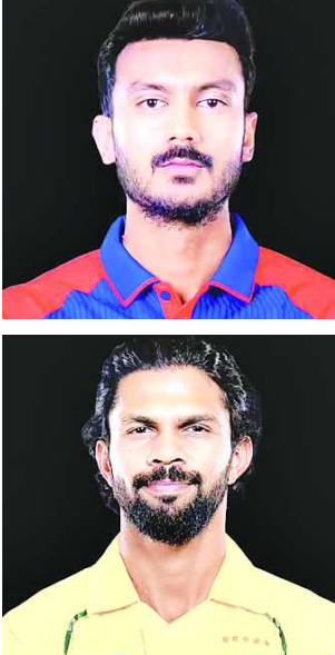
पहले बल्लेबाजी करते हैं, तो उनका यह सीजन अकसर अस्थिरता का शिकार हो जाता है, जिसकी झलक उनके नेटिव

नई दिल्ली (एजेसी) • दिल्ली कैपिटल्स और चेन्नई सुपर किंग्स के बीच मंगलवार को होने वाले लीग मुकाबले में दोनों टीमों प्लेऑफ में बनाए रखने की चुनौती का सामना करेंगी। दोनों टीमों के तालिका में समान अंक है। यह एक ऐसा अहम मोड़ लगता है, जो यह तय कर सकता है कि प्लेऑफ की दौड़ में कौन बना रहेगा और कौन दबाव के चलते पैदा हुई अफरा-तफरी में फंसता चला जाएगा। दोनों टीमों ने अपने नौ मैचों में से चार जीते हैं, दोनों के आठ-आठ अंक हैं। दोनों टीमों जानती हैं कि गलती की गुंजाइश तेजी से कम होती जा रही है। फिर भी, यहां तक पहुंचने के लिए उन्होंने जो रास्ते अपनाए हैं, वे एक-दूसरे से बिल्कुल अलग हैं। दिल्ली कैपिटल्स की बात करें, तो वह एक ऐसी टीम रही है जिसमें सब कुछ या तो बहुत अच्छा होता है या बहुत बुरा। जब वे लक्ष्य का पीछा करते हैं, तो वे निडर दिखते हैं और कभी-कभी तो उन्हें रोकना लगभग नामुमकिन लगता है। लेकिन जब वे