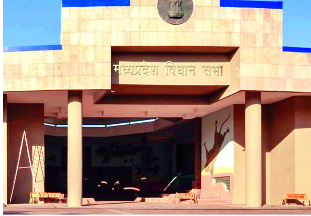
किया गया है। इस विशेष सत्र में और जोरदार हंगामे होने के आसार हैं। बता दें कि विधानसभा के विशेष सत्र बुलाए जाने की जानकारी रविवार को भाजपा प्रदेश कार्यालय में प्रेस कॉन्फ्रेंस आयोजित कर दी थी। इस संबंध में उन्होंने कहा था कि महिलाओं से जुड़े इस महत्वपूर्ण विषय पर विधानसभा में विस्तृत चर्चा की जाएगी। डॉ. मोहन यादव ने महिला आरक्षण बिल को लेकर कहा कि लोकतंत्र एक निर्णायक दौर से गुजर रहा है और संसद में जो घटनाक्रम हुआ, वह बेहद निंदनीय और कष्टकारी है। गौरतलब है कि सोमवार को भोपाल में भाजपा की ओर से नारी शक्ति वंदन बिल के समर्थन में आक्रोश रैली निकाली गई थी। जिसमें भाजपा नेताओं ने विपक्ष के खिलाफ नारेबाजी कर कई गंभीर आरोप लगाए थे।

भोपाल (एजेसी) • लोकसभा में नारी शक्ति वंदन बिल गिरने के बाद से भाजपा लगातार विपक्ष पर हमलावर है। इस बिल का समर्थन और विपक्ष का विरोध करने के लिए अब भाजपा सड़क पर उतरी आई है और विपक्ष पर महिलाओं के अपमान का आरोप लगा रही है। अब इसी क्रम में मध्य प्रदेश में सोमवार, 27 अप्रैल 2026 को एक दिवसीय विधानसभा का विशेष सत्र बुलाया गया है। इस सत्र में नारी शक्ति वंदन बिल को लेकर चर्चा की जाएगी। विधानसभा सचिवालय ने आदेश जारी कर दिया है। सदन की कार्यवाही सुबह 11 बजे से शुरू होगी। इसमें सभी सदस्यों को उपस्थित होने के लिए आमंत्रित