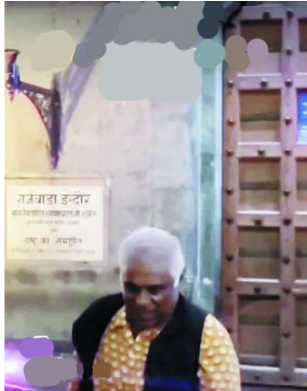
इंदौर। फिल्मि कलाकार आशीष विद्यार्थी इंदौर के राजवाड़ा पर नजर आए।