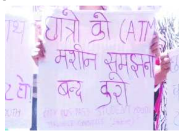
चौराहे की समस्या बताई, सफाई की मांग की