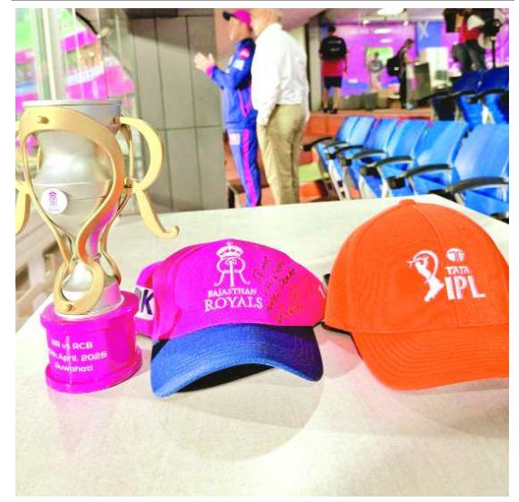
मुंबई • वैभव सूर्यवंशी की कल की शानदार पारी पर किंग विराट कोहली ने वैभव की कैप पर अपना ऑटोग्राफ दिया।

चेन्नई (एजेंसी) • पांच बार की विजेता और इस समय लडखड़ा रही चेन्नई सुपर किंग्स के लिए अब तक का सफर काफी कड़वा रहा है। लगातार तीन हार झेलने के बाद, घरेलू मैदान पर खेल रही यह पसंदीदा टीम शनिवार रात एमए चिदंबरम स्टेडियम में एक अहम आईपीएल मुकाबले में आत्मविश्वास से भरी दिल्ली कैपिटल्स का सामना करते हुए अपनी किस्मत पलटने की उम्मीद करेगी। टीम के प्रदर्शन से यह साफ जाहिर होता है कि उसे अपने दिग्गज खिलाड़ी