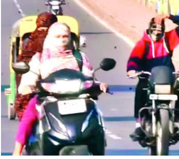
गर्म हवाओं का असर कम होने से पिछले तीन दिन से सुबह 8 बजे के समय भी ठंडापन

इंदौर • छह दिन में 3 डिग्री गिरा पारा, रात के तापमान में भी कमी आई, सुबह हलकी ठंड का हो रहा अहसास गर्मी ने फिर यू-टर्न लिया है। राजस्थान तरफ से आ रही गर्म हवा कमजोर पड़ते ही दिन-रात के तापमान में एकदम से गिरावट आ गई। छह दिन पहले अधिकतम तापमान 38 डिग्री तक पहुंच गया था, जो घटकर 35 डिग्री पर आ गया है। वहीं दो रात पहले 19 डिग्री तक पहुंचा न्यूनतम तापमान 16.8 डिग्री के लेवल पर आ गया है। मंगलवार को अधिकतम तापमान 34.9 डिग्री रहा, जो सामान्य से 1 डिग्री कम दर्ज किया गया।