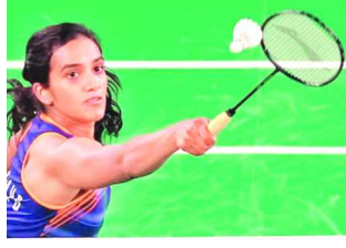
ही वापसी करेंगी।