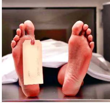
के आंकड़े बता रहे हैं कि 57 हजार तो सामान्य मौतें हैं, जिनकी उम्र 18 से 60 वर्ष के बीच है। इन्हें 1140 करोड़ रुपए

भोपाल (एजेंसी) • वर्ष 2025 में मप्र के 69 हजार असंगठित श्रमिकों की मौत ने शासन की नींद उड़ा दी है। हैरानी यह है कि मुख्यमंत्री जनकल्याण (संबल) योजना में पंजीकृत इन असंगठित श्रमिकों में सभी की उम्र 60 साल से कम है और 90% मौतें सामान्य रजिस्टर्ड हुई हैं। ये संख्या वर्ष 2024 से 12 हजार और 2023 से 21 हजार ज्यादा है। पहली बार श्रम विभाग इसके कारणों को तलाशने जा रहा है। ऐसी मौतों पर हर साल करीब 1200 से 1500 करोड़ के करीब मुआवजा बंट रहा है। संबल योजना में पंजीकृत श्रमिकों की सामान्य मौत पर दो लाख रु. और दुर्घटना में मौत पर 4 लाख रु. दिए जाते हैं। 2024-25