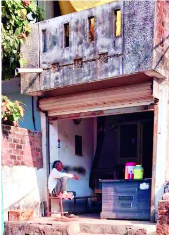
झोलाछाप डॉक्टर का क्लीनिक ना बोर्ड लगा ना डिग्री

देपालपुर • दैनिक इंदौर संकेत ग्रामीण क्षेत्रों में झोलाछाप डॉक्टर कर रहे धड़ल्ले से इलाज अधिकतर ग्रामीण अंचल में बंगाली डॉक्टरों ने अपना जाल बिछा रखा है इनके पास किसी भी दर्द का इलाज करवा लो हमेशा इलाज के लिए तैयार रहते हैं। सबसे बड़ी बात ना इनके पास परमिशन ना डिग्री ना पंचायत की अनुमति उसके बावजूद भी गांव-गांव में दो से तीन बंगाली डॉक्टर आपको मौजूद मिलेंगे ऐसा ही हाल बनेडिया के ग्रामीण क्षेत्र में देखने को मिला यहां एक क्लीनिक पर ना तो बोर्ड लगा है ना डिग्री दिखाई देती है। लेकिन बरसों से एक झोलाछाप डॉक्टर यहां इलाज कर रहे हैं इतना ही नहीं इस क्लीनिक पर इंजेक्शन लगाने से लेकर बोतल लगाने तक की तमाम व्यवस्थाएं हैं। बनेडिया में क्लीनिक पर पहले भी छपा मार कार्यवाही की गई थी। बड़ी मात्रा में खाली इंजेक्शन खाली बोतल यहां से बरामद की गई थी साथ ही इस क्लीनिक पर लगभग आठ से दस पलंग भी लगे हुई मिले थे इस क्लीनिक को सील भी किया गया था, लेकिन शासन प्रशासन