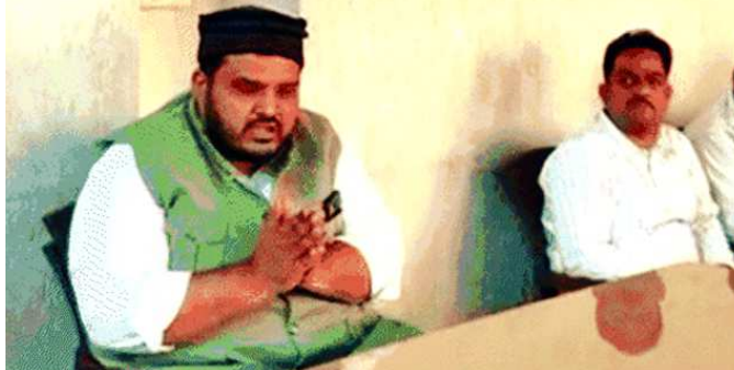
खिलाफ केस दर्ज किए गए। इनमें से इसके जवाब में गृह विभाग की ओर से कितने मामलों में खाम्ता लगाया गया। बताया गया कि जनवरी 2024 से